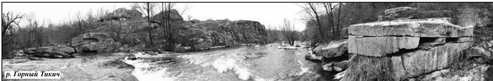
р. Горный Тикич

Хорошо весной в нашем местечке! Начинает зеленеть трава, подсыхает надоевшая грязь, сходит оставшийся в ложбинах снег. Каждую весну мы пополняли свои «арсеналы» - у каждого пацана был свой склад немецкого оружия, оставшегося в этой перепаханой недавней войной земле и находимого нами повсюду. Чего у нас только не было - «Шмайсеры», «Вальтеры», кинжалы с надписью по-немецки «С нами бог», каски. Мы даже знали место на реке, где находился затопленный «Тигр», и в нем находили патроны... Какого мальчишку не влекло к себе оружие? Кому из нас не хотелось подержать в руках эту железную штуковину, которая делает