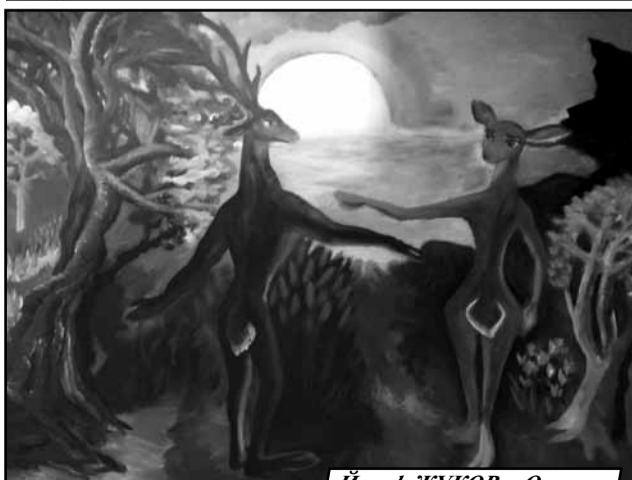
Йосеф ЖУКОВ. «Олеги»