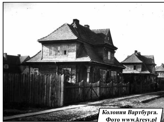
Колония Вартбурга.

вочнике гор. Брест-Литовский на 1912 год», Я. М. Хмелевский пишет: