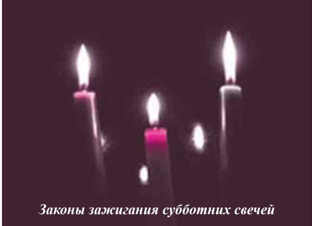
Законы зажигания субботних свечей

Зажжение субботних свечей обязательно. Об этой заповеди говорится в Талмуде «Шабат», лист 25. «Уважение к субботе - это когда трапеза проходит при свете», - комментирует Талмуд Раши. А Тосафот дополнительно объясняют, что проведение субботней трапезы при свечах увеличивает удовольствие от субботы. Из слов Тосафот очевидно, что есть две обязанности: во-первых, необходимо зажечь свечи, а во-вторых, кушать в освещенном месте. Вторая заповедь относится уже к закону ойнег шабес (удовольствие от субботы - иврит).