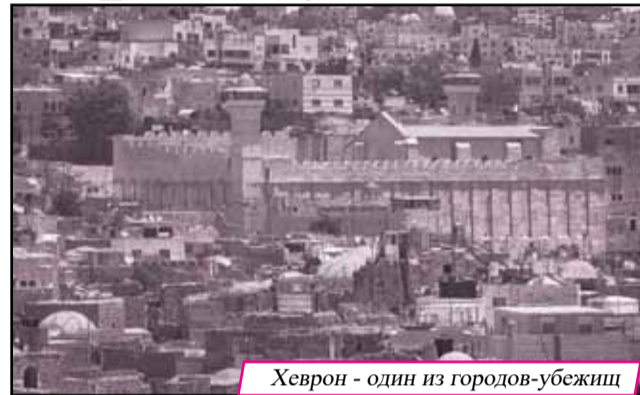
Хеврон - один из городов-убежищ

на поступки, которых желает «животная» душа. И поскольку человек не подавляет в себе желаний «животной души», а в большинстве случаев еще и способствует им своим поведением - он заслуживает наказания и нуждается в искуплении. А искупление осуществляется в городах для убежища, то есть в ссылке.