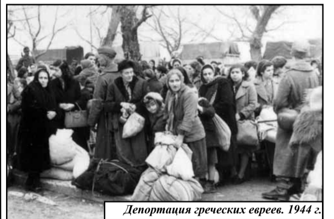
Депортация греческих евреев. 1944 г.

В музее «Яд вашем» в Иерусалиме на аллее праведников посажены деревья в честь греков, спасавших евреев в годы Второй мировой войны. Есть там и дерево принцессы Алисы фон Баттенберг, принцессы Греческой и Датской, которая в самые страшные годы гитлеровской оккупации прятала в своем доме еврейские семьи.