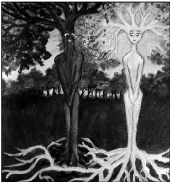
Йосеф Жуков. Деревья